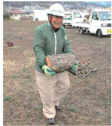
シルバーで働く様子

町ですれ違って同じ会員同士だと気が付かない時があり常々寂しく感じていたが、今年会員交流の