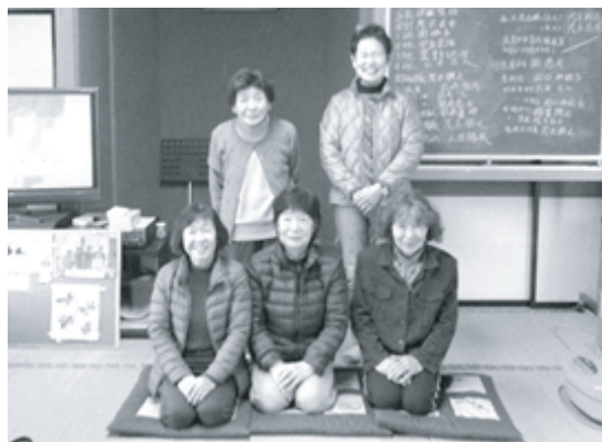
泉ふれあいサロンの皆さん