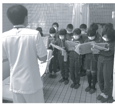
説明を真剣にメモする様子

11月22日、東小学校4年生14名が総合学習の一環で福寿草を見学されました。重度の利用者が入浴する際に使用する特殊な機械装置に関心が寄せられていました。