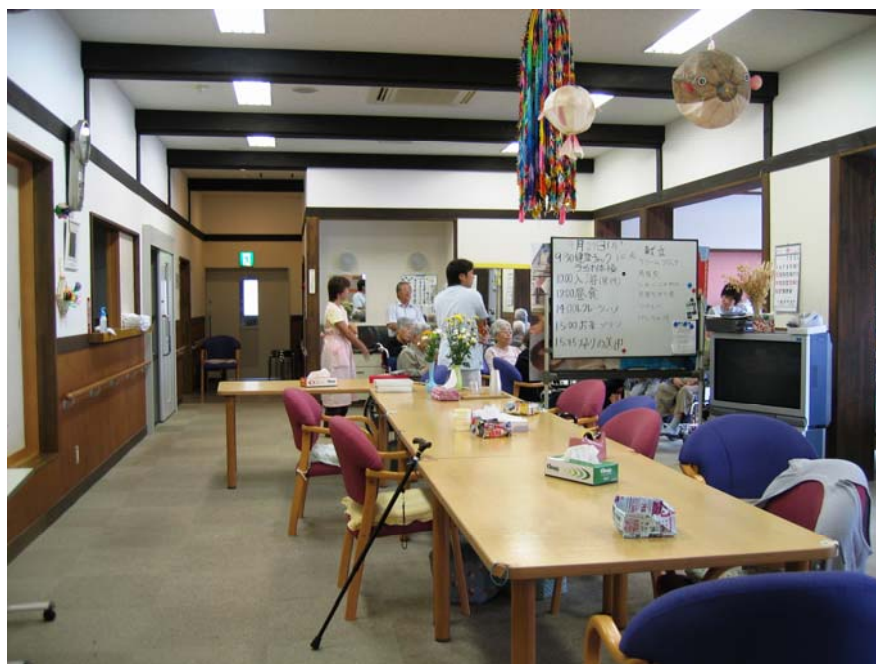
ダイニング、食堂、機能訓練室

お食事、レクリエーションなどで会話もはずみ、充実した時間をお過ごしいただけます。ご自由におくつろぎ下さい。