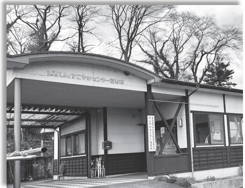
すこやかセンター福寿草

これまで長きにわたりご利用いただきました利用者のご家族の皆様、施設を支えてくださったボランティアや地域住民の皆様、行政・関係機関の皆様へ深く感謝申し上げます。