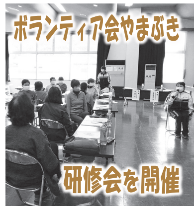
実践を交えた研修会