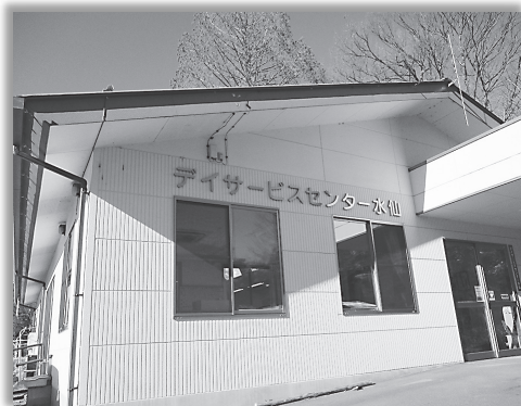
デイサービスセンター水仙

本会が運営してきた「デイサービスセンター水仙」と「すこやかセンター福寿草」は今年度末をもって閉所いたします。