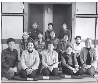
大戸ふれあいサロンの皆さん