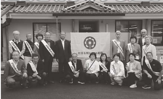
町推進委員会のみなさん

法務省主催の「第69回社会を明るくする運動」が7月を強調月間に全国で展開されました。運動の一環として封筒募金をお願いしたところ4398世帯から88万3452円の募金をいただきました。ここに報告申し上げます。 なお、募金は全額、吾妻保護区保護司会に納付され、犯罪や非行の防止、青少年の健全育成等を中心とする「社会を明るくする運動」や罪を犯した人の更生に活用されます。 募金の2割（17万6691円）が社会福祉協議会に交付され、ケール研究会等の社会を明るくする運動の経費に充てさせていただきます。