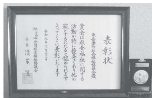
受賞した表彰状と賞牌

この度、地域の助け合いや支え合い、見守り活動などの地域づくり活動に対し住民が主体となって取り組まれている活動が認められ、全国社会福祉協議会長から「社会福祉協議会優良活動表彰」を受けました。ご尽力いただいております地域住民、関係者のすべての皆様に感謝申し上げますとともにご報告いたします。