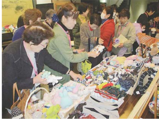
人気の福祉バザー

このふれあい広場は、コンベンションホールを会場に町ボランティア連絡協議会が主催で、会に加盟するボランティア団体（7団体）の活動を広く町民へ知ってもらおうと、毎年開催しているイベントです。