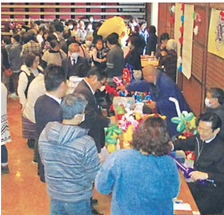
多くの来場者で賑わう会場内

このふれあい広場は、コンベンションホールを会場に町ボランティア連絡協議会が主催で、会に加盟するボランティア団体（7団体）の活動を広く町民へ知ってもらおうと、毎年開催しているイベントです。