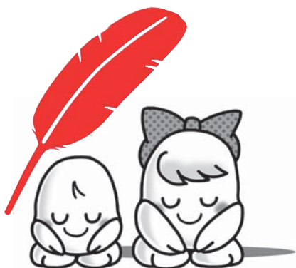
「希望くんと愛ちゃん」 共同募金のシンボルキャラクター