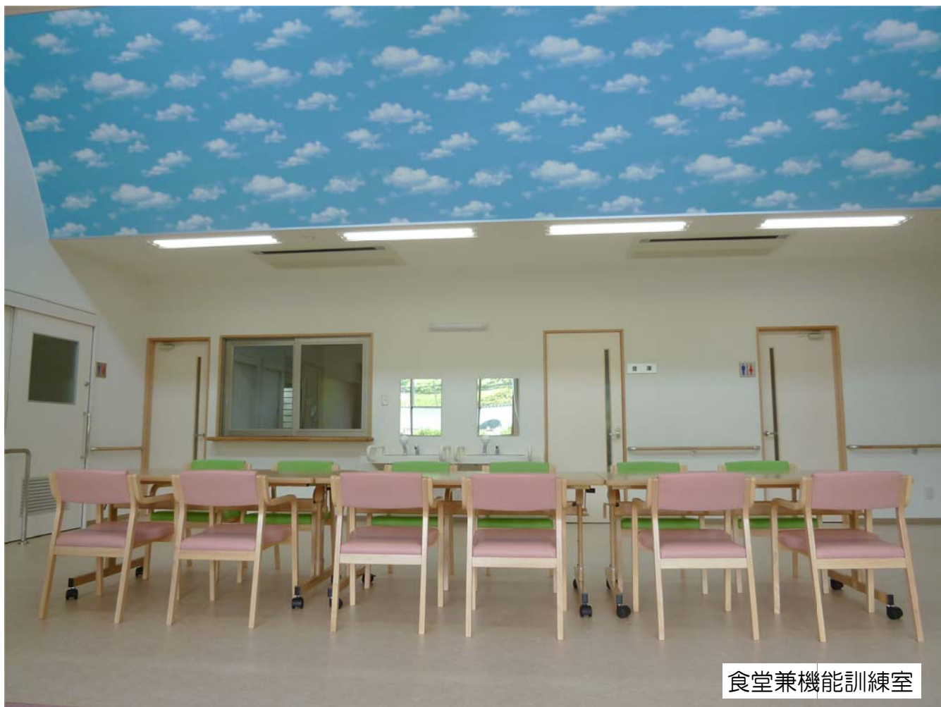
食堂兼機能訓練室